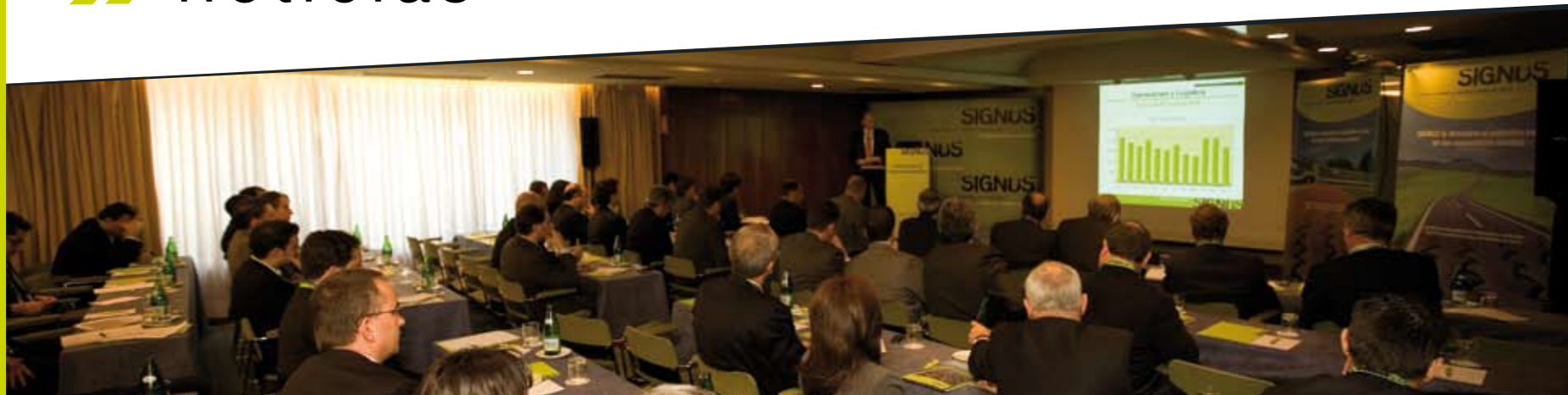
TABLA ECOVALOR SIGNUS