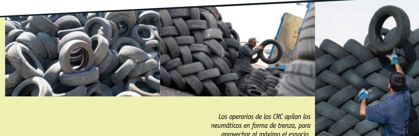
Los operarios de los CRC apilan los neumáticos en forma de trenza, para aprovechar al máximo el espacio.

CRC llevan a cabo la clasificación de los neumáticos, separando y comercializando por su cuenta para su reutilización aquellos que todavía conservan potencial de uso. Los que ya han alcanzado el final de su vida útil pasan a disposición de otro tipo de gestor contratado por SIGNUS para recibir el tratamiento más adecuado desde el punto de vista medioambiental.