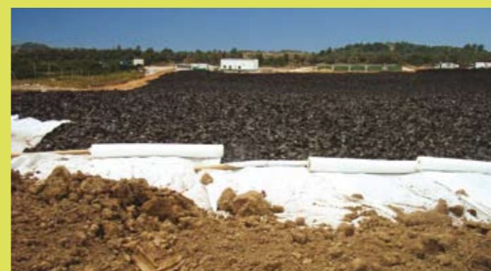
Varios momentos de la construcción de la capa de drenaje de aguas superficiales del antiguo vertedero de L'Aldea.

En la construcción de la capa de drenaje de aguas superficiales del depósito de residuos de la localidad tarraconense de L'Aldea se han empleado 5.300 toneladas de triturado de NFU